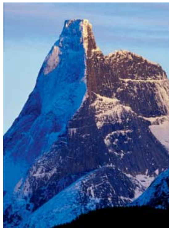
Fra fjorden ser du rett på Norges nasjonalfjell; Stetind.

Reisen til Tysfjord: Fly til Evenes, buss og ferge til Tysfjord Turistsenter eller ferge fra Svolvær og buss fra Skutvik til Tysfjord Turistsenter.