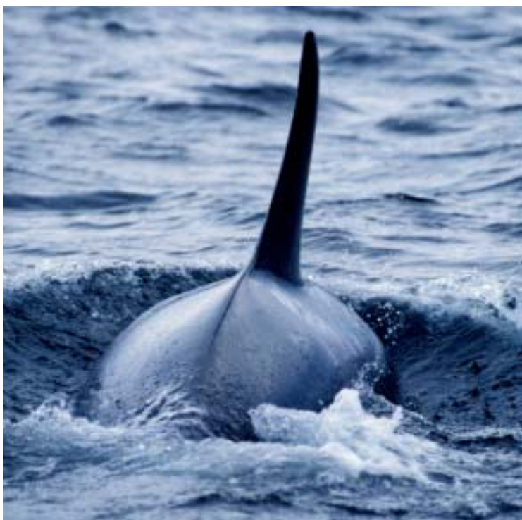
De store hvalen kommer ofte til syne rett ved båtene. De er så nærmte at vi kan ta på dem. Et lite slag med halen – og vi hadde alle ligget i vannet. Men det skjer ikke ...