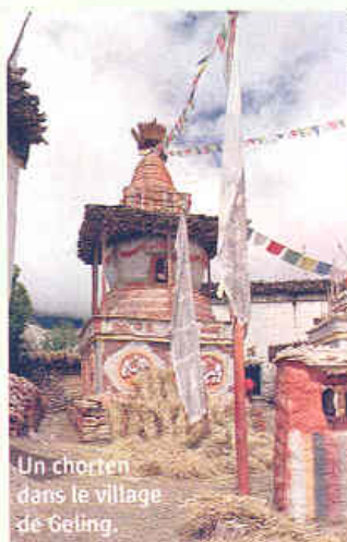
Un chorten dans le village de Geling.