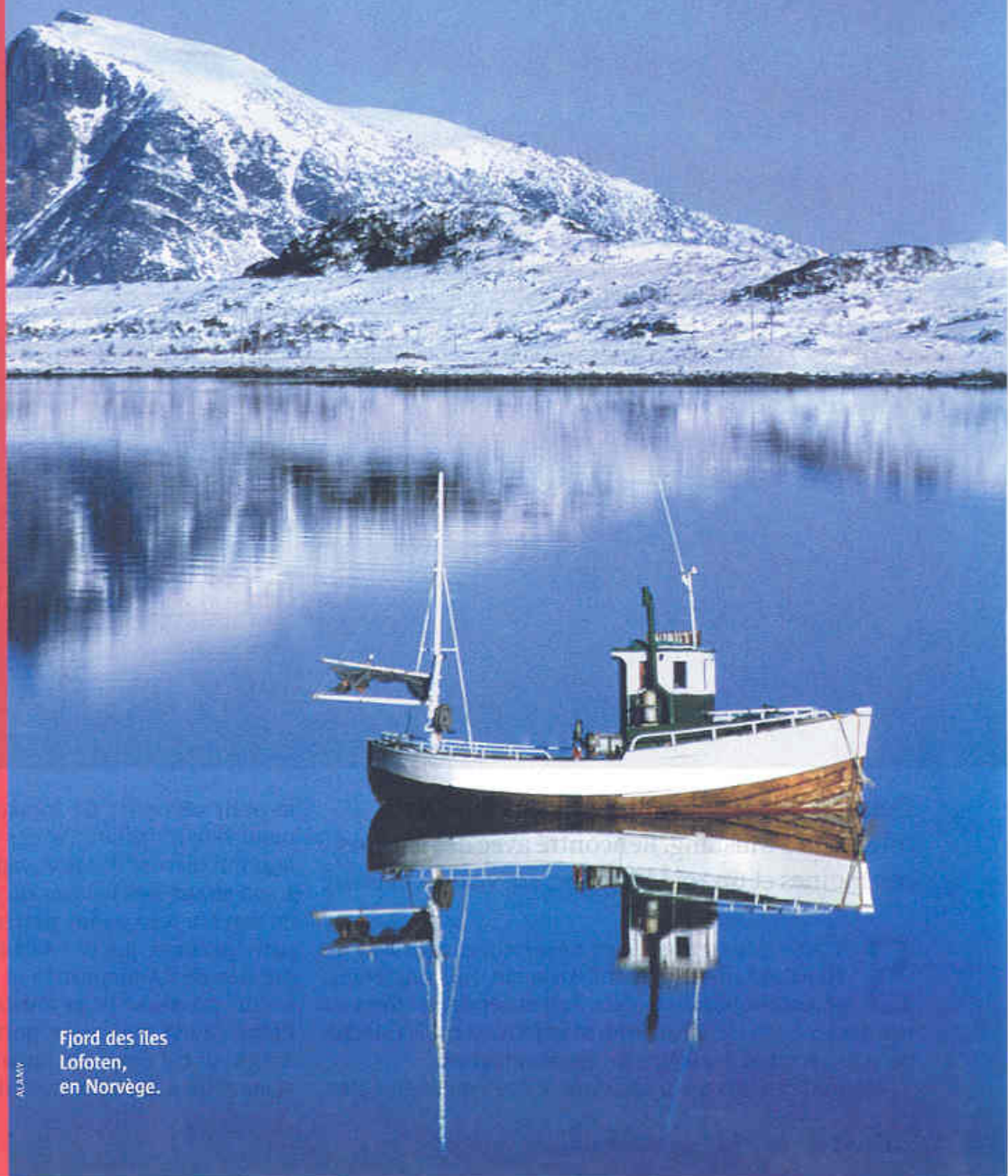
Fjord des îles Lofoten, en Norvège.

DOSSIER DIRIGÉ PAR BRIGITTE HERNANDEZ, AVEC NATHALIE PESSÉL. ICONOGRAPHIE : SYLVIE BASDEVANT-SUZUKI. MAQUETTE : DANIEL LAJOIE.