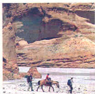
En suivant le lit de la rivière Kaligandaki.

Pour rejoindre le Mustang : impossible d'envisager le trek sans passer par une agence.