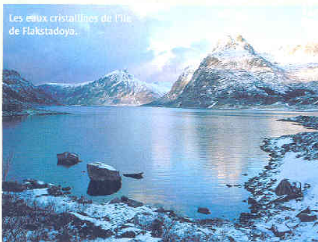
Les eaux cristallines du Fjord de Flakstadoya.